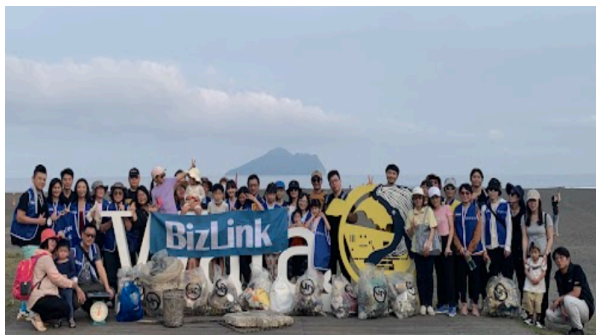
3月30日宜兰净滩活动