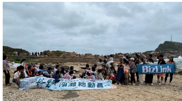
10月20日新北净滩活动